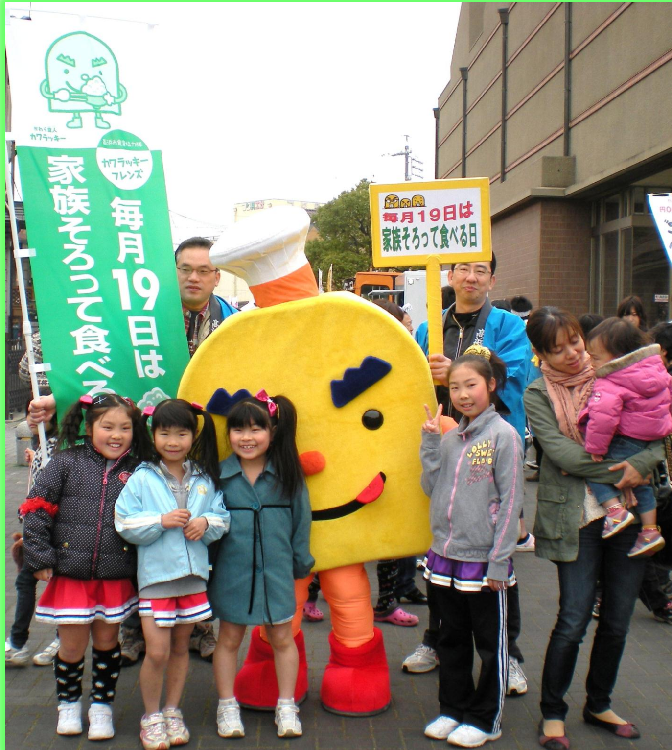
学校、幼稚園、保育園、カワラッキーフレンズのお店など 毎月19日には、緑色ののぼり旗を掲示しています。 (のぼり旗は、カワラッキーフレンズのおとうふ工房いしかわ様より寄贈)

幼稚園 → 毎月19日は給食の写真を保護者向けに掲示しています。 降園時に親子の会話がはずみます。