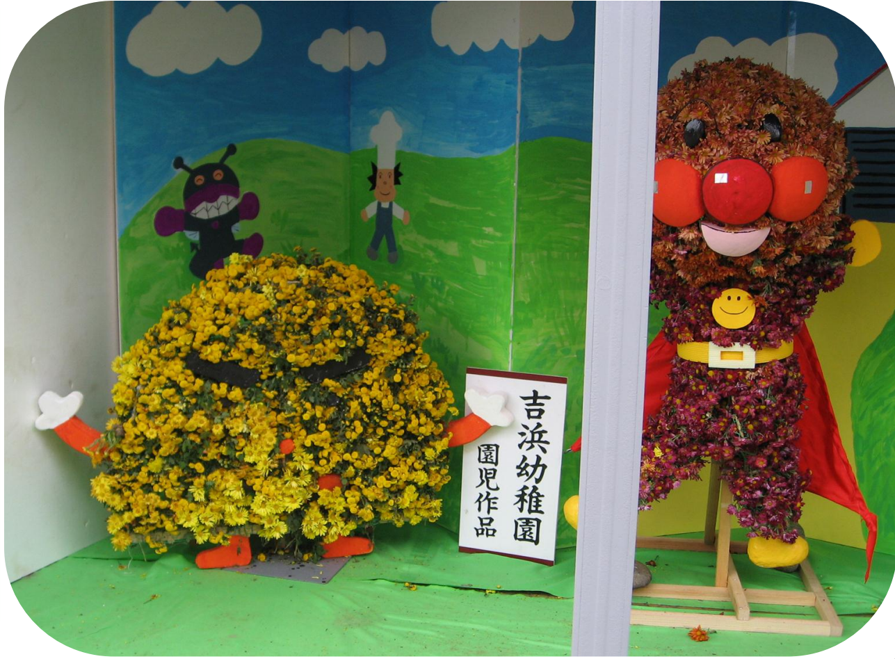
カワラッキー菊人形 幼稚園・保育園児がおじいちゃんたちに教えてもらってつくりま