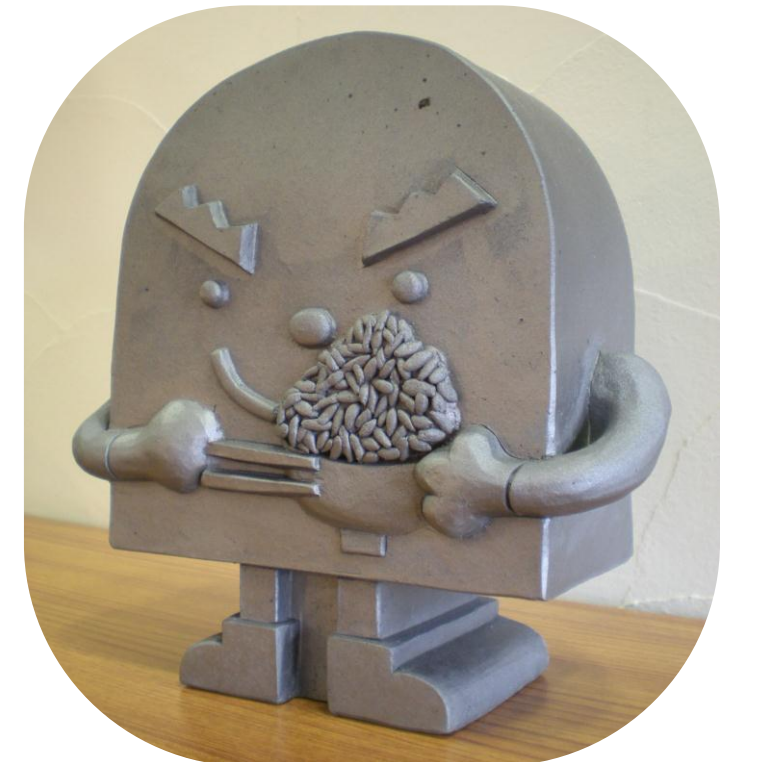
地場産業の瓦職人が制作した 瓦のカワラッキー(株丸市)