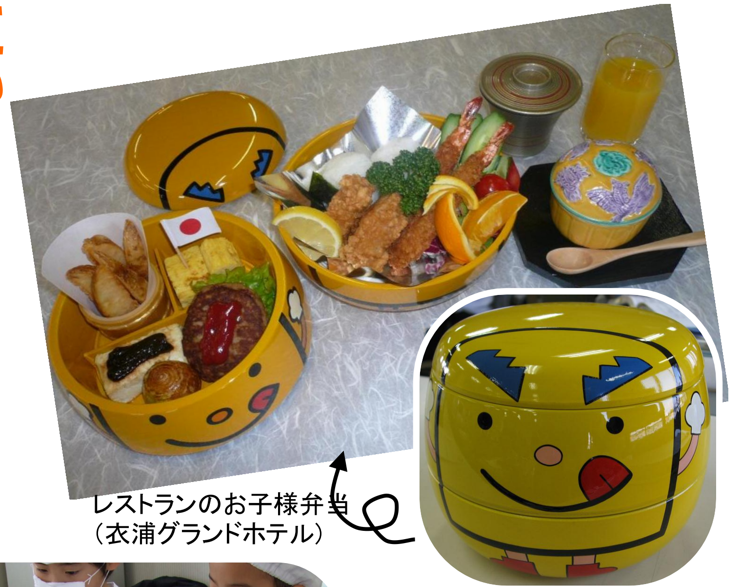
レストランのお子様弁当 (衣浦グランドホテル)